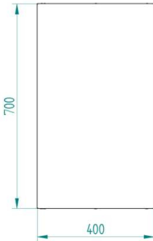
Рис. 2 Полка ПНО (вид сбоку)