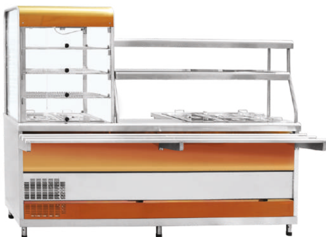
ПВХМ-70КМУ «цвет красное золото»